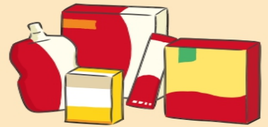
たんぱく質や、たんぱく質の 成分である必須アミノ酸 (特にロイシン)が摂れるものを 選びましょう。

一回の食事で摂りきれない栄養素は間食で賄ったり トッピングでプラスして補います。 ただ、間食の摂りすぎには注意が必要です！！